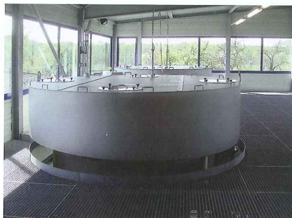
Bild 3. Ablaufkrone SEK-Reaktoren.