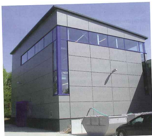
Bild 1. Trinkwasserenthärtungsanlage im WW Ottersdorf.

Die Technologie des Wirbelbettreaktors wurde im Wesentlichen in den 30er Jahren in Deutschland bis zur Anwendungsreife entwickelt; der Durchbruch dieser Technologie in der großtechnischen Anwendung fand aber hauptsächlich im Ausland, hier insbesondere in Holland, statt. Die verfahrenstechnische Auslegung dieser Reaktortechnik war damit auch auf die dort üblichen großen zentralen Wasserversorgungsunternehmen abgestimmt und damit nicht direkt auf Deutschland übertragbar.