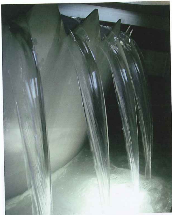
Bild 5. Enthärtetes Wasser im Reaktorablauf.